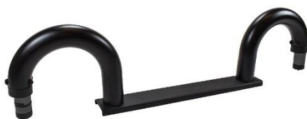
Black Bars Part No: WTP00B21