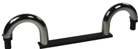
Chrom Bars Part No: WTP00B09